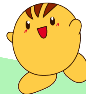
JA兵庫六甲イメージキャラクター 「ろくちゃん」

JA（農業協同組合）は、食と農を基軸とする 地域に根ざした「協同組合」です 組合員の一人ひとりが力を合わせ、みんなの願いを かなえていく組織です